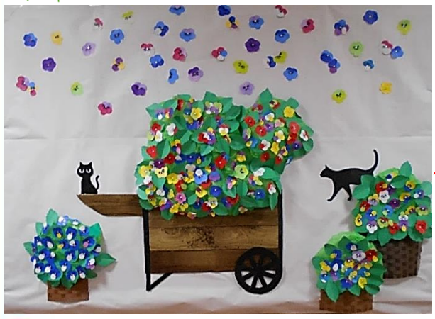
脳トレーニングクラブ