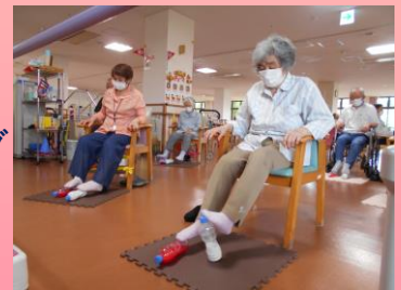
ペットボトル体操の様子