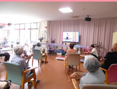
脳トレーニングの様子